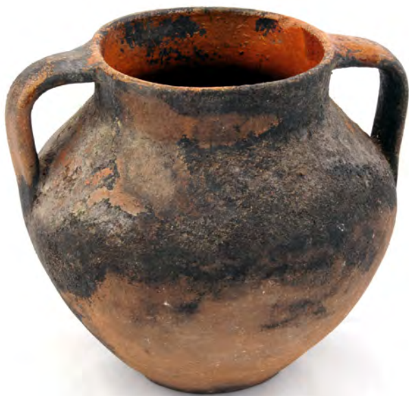
Panela COJ N.º INV. 310