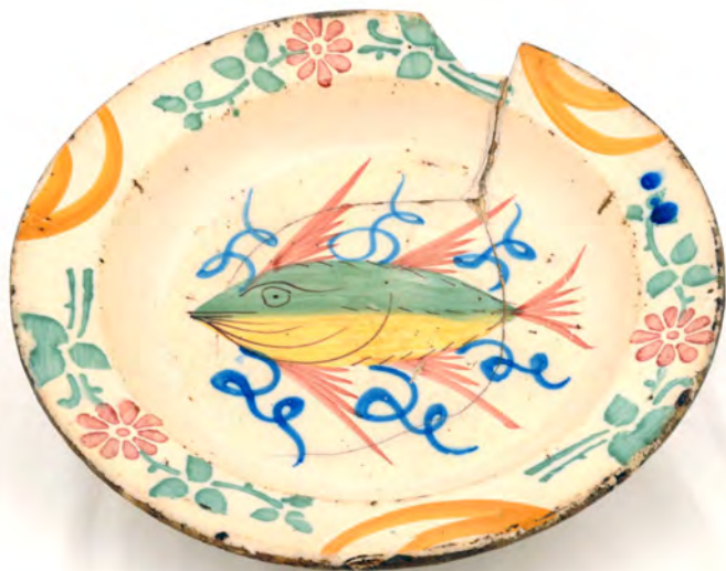
Prato COJ N.° INV. 131