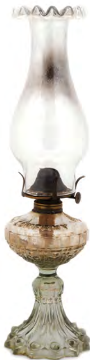
Candeiro COJ N.º INV. 208