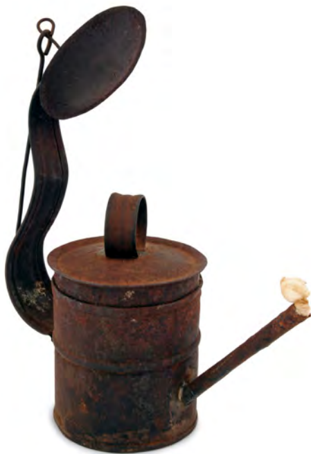
Candeia COJ N.º INV. 216