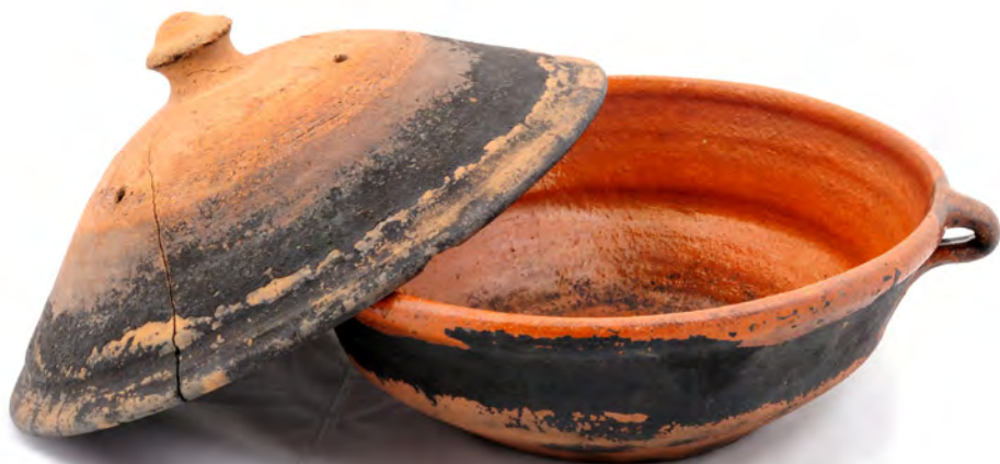
Caçoila com tampa COJ N.º INV. 311