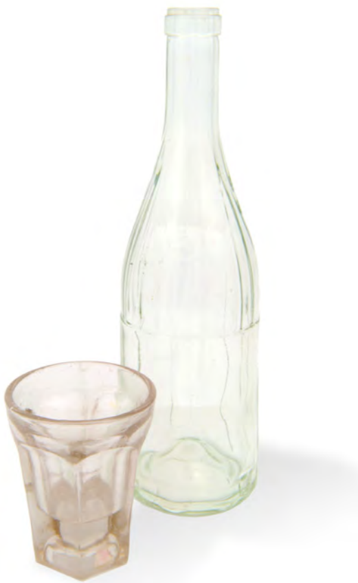
Copo COJ N.º INV. 36