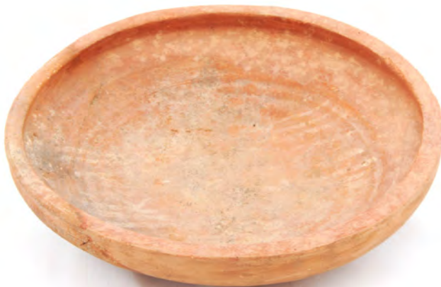
Caçoila do período islâmico MM N.º INV. CR/PT/0006