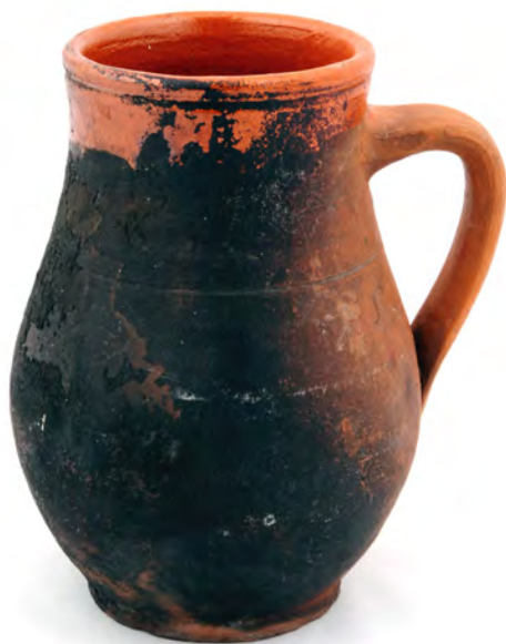
Panela COJ N.º INV. 408