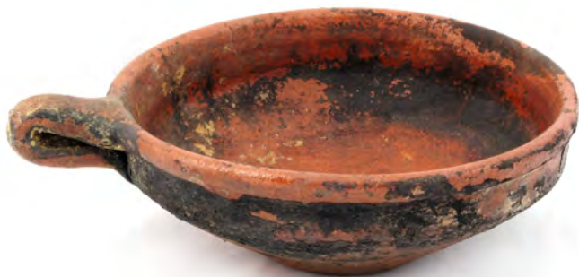
Caçola COJ N.º INV. 409