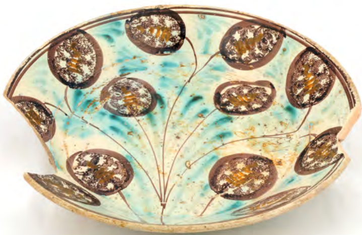
Prato COJ N.° INV. 130