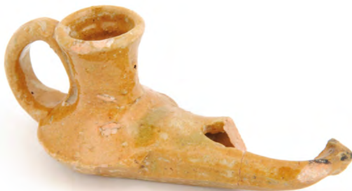
Candil do período islâmico MM N.º INV. CR/CF/0055