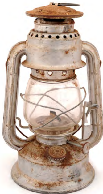
Lantern COJ N.º INV. 199